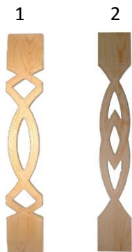
БАЛЯСИНА №1 БАЛЯСИНА №2